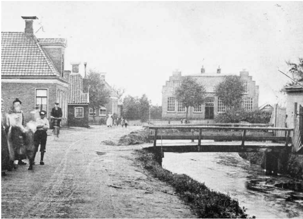
Martenshoek: Molenslootje en Molendijk. 1908

niet voor elkaar. De Molensloot komt later nog eens in het nieuws, maar daar zat een luchtje aan. In deze tijd is Martenshoek nog niet het centrum dat het rond 1900 zal gaan worden om de heel eenvoudige reden dat er nog geen winkels waren zoals nu, men was veel meer ingesteld op zelfverzorging, wel wordt er reeds over een dichte aaneengesloten bebouwing gesproken, waar men naast veel ambachtlieden, veel kroegen, en stille knippen vond.