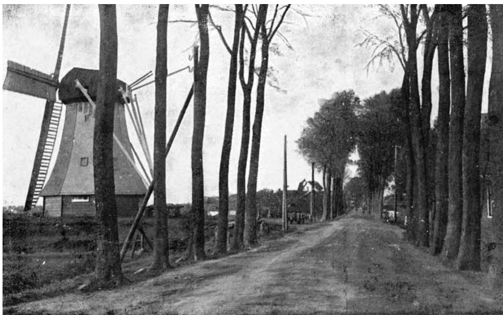
Molen 'De Hoop' Kropswolde