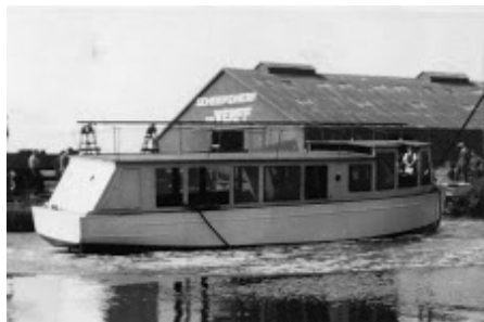
Bootje voor de missie omstreeks 1950