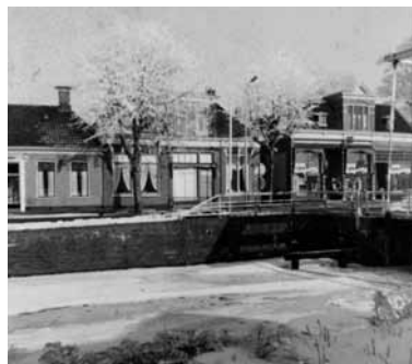
Bakkerij Boerema met rechts het huis met de grote portiek en links Radio Aeilkema