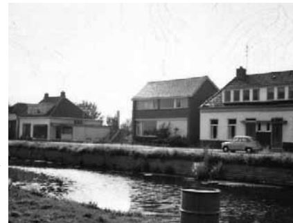
Links muziekhandel Pekelder na de brand. Op het openstuk stond bakkerij Woldhuis en waar het nieuwe huis staat rechts hiervan, stond het afgebrande huis van Pekelder