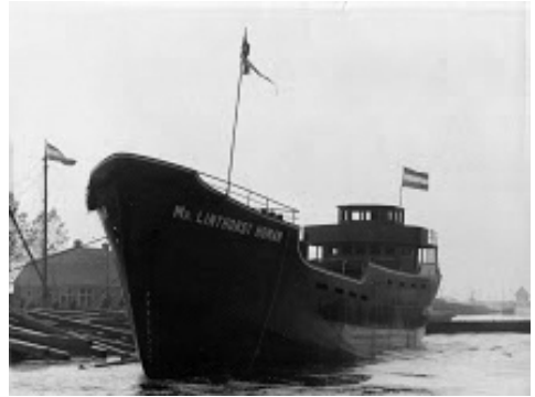
MS Mr. Linthorst Homan, uiterst rechts nog net zichtbaar het sluis-kantoor