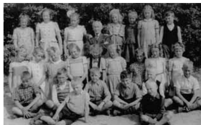
RK lagere school met Jos rechts onder

Daarnaast was hij jarenlang penningmeester van het Kerkbestuur van de St. Martinuskerk en ook van het Schoolbestuur van de St. Gerardus Majella school. Daarvoor werd hij op 12 oktober 1962 gehuldigd met de pauselijke onderscheiding "pro Ecclesia et Pontifice". Deze werd hem uitgereikt door pastoor W.G. Nieuweboer.