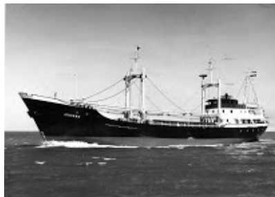
Proefvaart JOHNNY mei 1959

Op 10 juli 1963 werden ten overstaan van notaris J.G. van Buizen door de firma Troostwijk gereedschappen en machines verkocht .